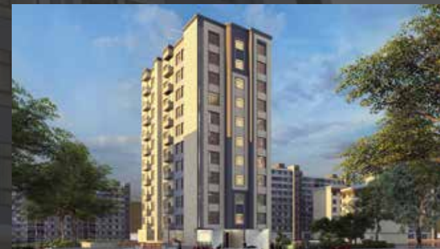
صنعاء شارع الاصبحي